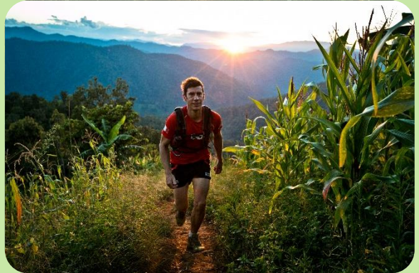
DAY 4 Le village Lahu a 1100m