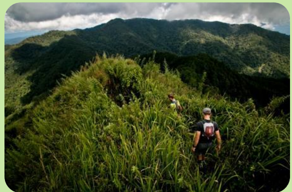
DAY 5 Le Haut Pays Lahu