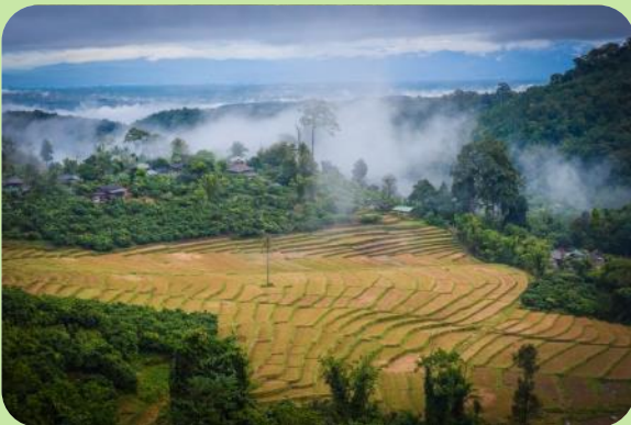
DAY 2 Le village de nuit Karen