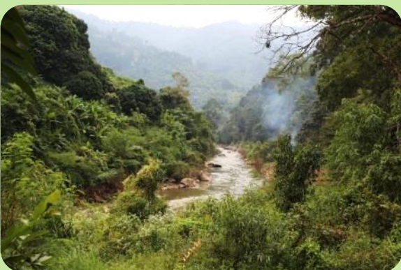
DAY 3 Le long de Mae Teng river