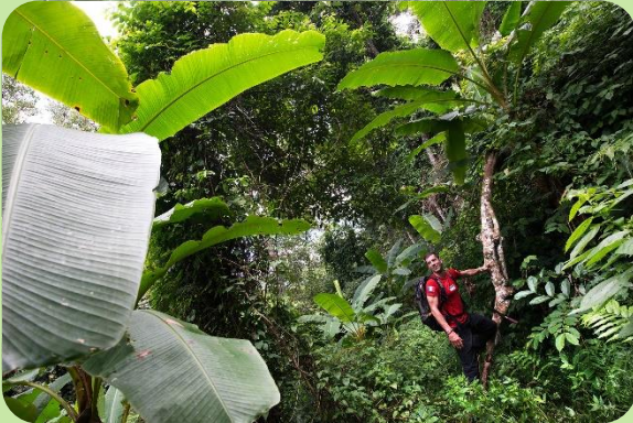
DAY 1 Rando en pleine jungle