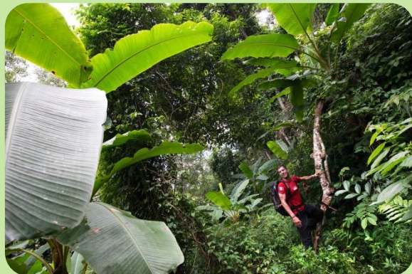
Jungle de Doi Pui