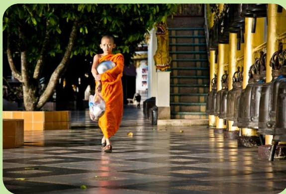
Temple de Wat Doi Suthep