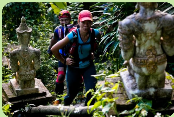
Temple de Wat Palaad